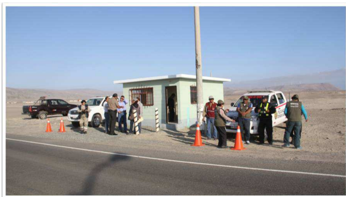
La garita se encuentra ubicada en la entrada del distrito

Recordemos que meses atrás, la empresa donó 12 modernos patrulleros totalmente equipados a la Región Ica, de los cuales dos se encuentran vigilando las calles de la localidad. De este modo, Shougang Hierro Perú contribuye a mejorar la seguridad ciudadana en Marcona.